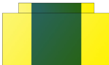
Configuration n°2 : 1 rampe d'accès centrale