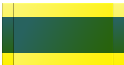
Configuration n°1 : 2 rampes d'accès